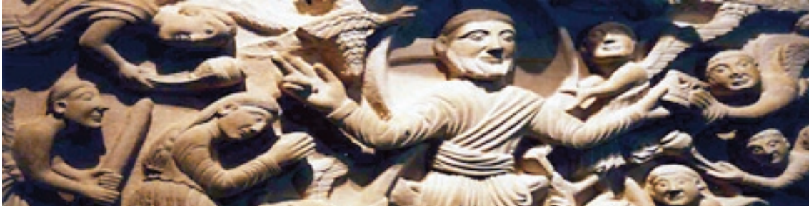
Bas-relief de l'église de Bardone, site casadéen